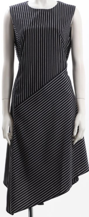
パターン ID 21498 ブランド ELEGARMENT