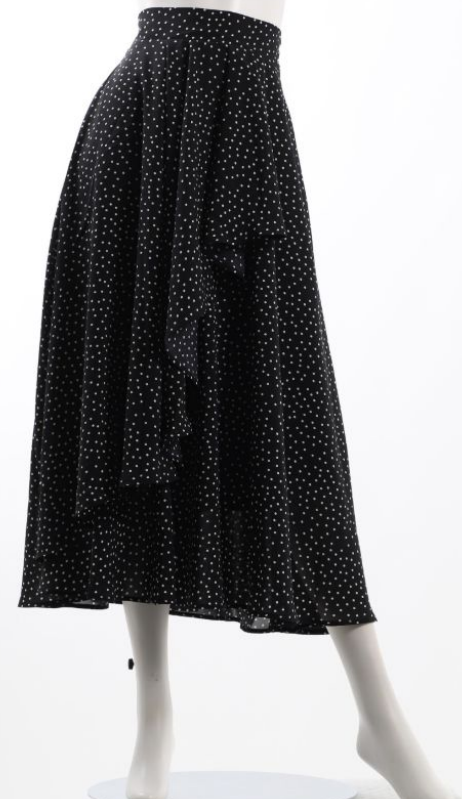
パターン ID 49623 ブランド ELGNA