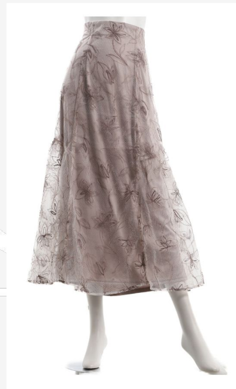
パターン ID 53477 ブランド SMILE LAND