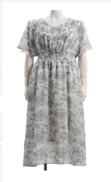
パターン ID 53608 ブランド CARINA LUCE