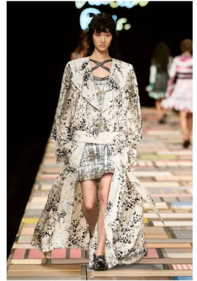
ルイ・ヴィトン (LOUIS VUITTON)