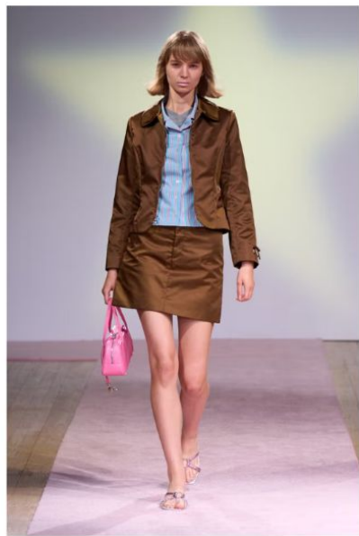
サンディー リアング (SANDY LIANG)