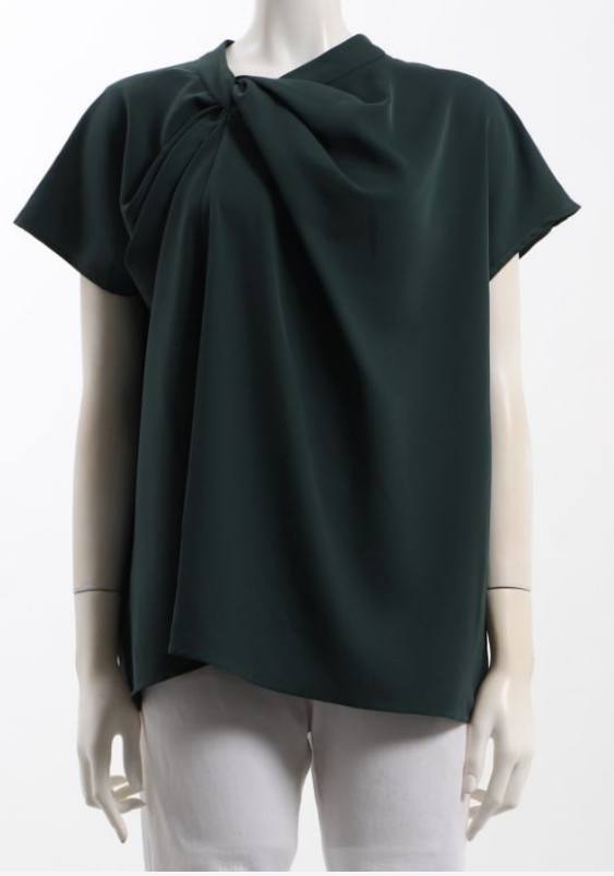
パターン ID 54090 ブランド humpy