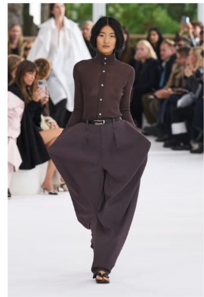
イッセイ ミヤケ (ISSEY MIYAKE)

ブラウンはそれ自体にやわらかくリラックスした雰囲気をもつため、都会的なムードに仕上げるなら、タイトなシルエットや深いスリットなどシャープな要素をプラスしてみると。