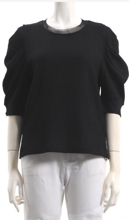
パターン ID 54394 ブランド SILPLAIRE