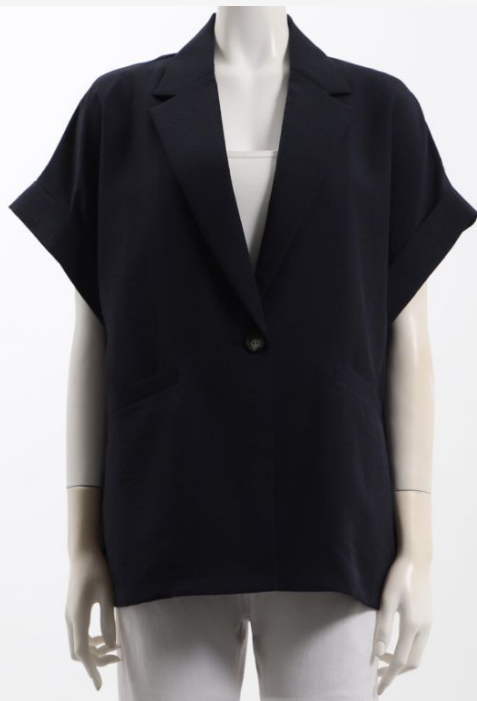
パターン ID 54245 ブランド innowave