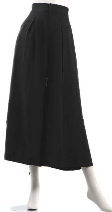
パターン ID 54342 ブランド ELGNA