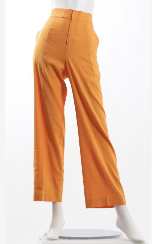
パターン ID 38770 ブランド NOLLEY'S