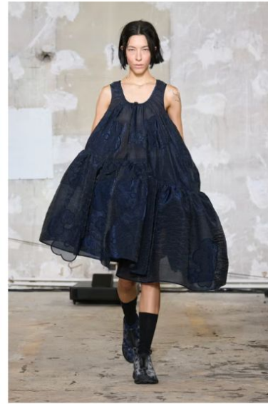
セシリー バンセン (CECILIE BAHNSEN)