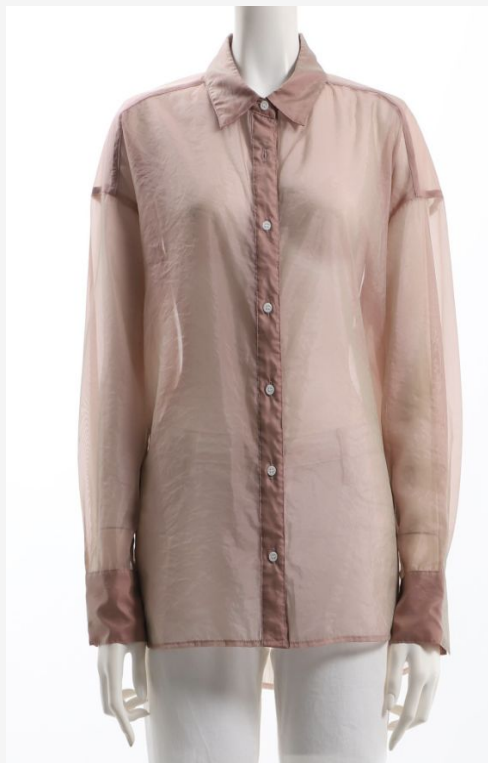
パターン ID 48884 ブランド innowave