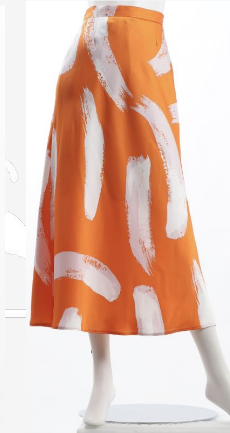
パターン ID 38377 ブランド ADAM ET ROPÉ