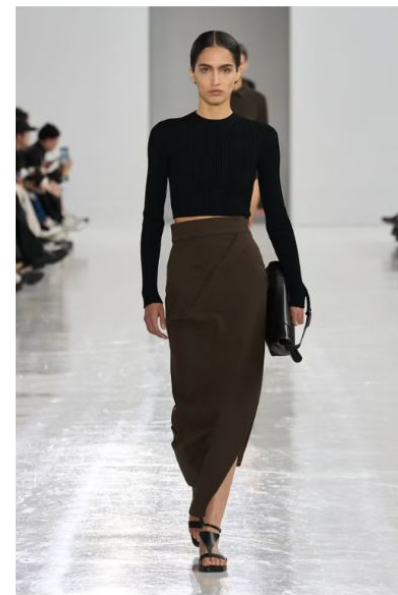
マックス マーラ (MAX MARA) paolo lanzi // LAUNCHMETRICS SPOTLIGHT