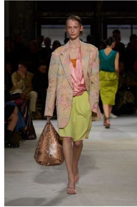
ドリス ヴァン ノッテン (DRIES VAN NOTEN)