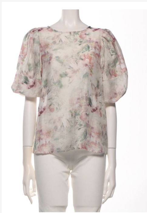
パターン ID 54315 ブランド ELGNA