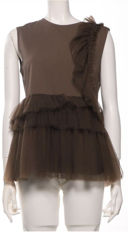
パターン ID 54206 ブランド Mila Owen