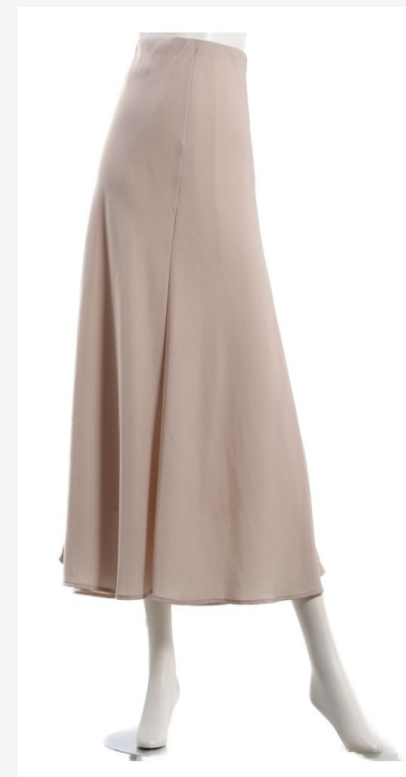
パターン ID 54173 ブランド Mila Owen