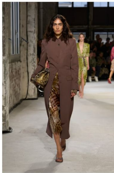
ドリス ヴァン ノッテン (DRIES VAN NOTTEN)