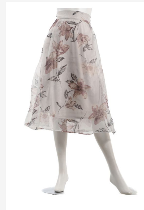
パターン ID 53413 ブランド Cleome