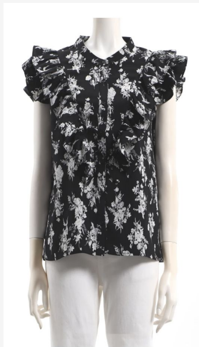
パターン ID 52945 ブランド MARBLEWALTZ