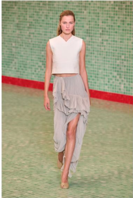
トリー バーチ (TORY BURCH)

存在感のあるアシンメトリーなアイテムは思い切り大胆に取り入れると◎です。アシンメトリーのスカートをシンプルなトップスと合わせれば日常にもなじみやすいです。