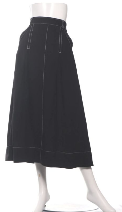
パターン ID 54330 ブランド ELGNA