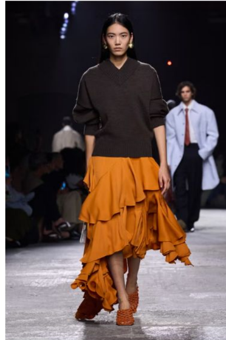
ボッテガ・ヴェネタ (BOTTEGA VENETA)