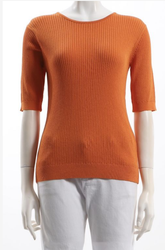
パターン ID 39454 ブランド LAVEANGE