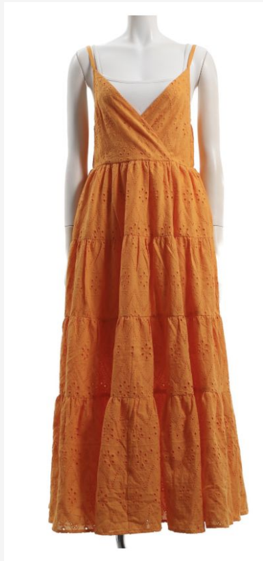
パターン ID 53237 ブランド Ordinary Federation