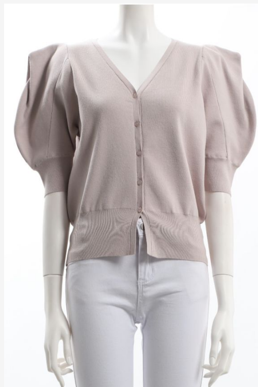
パターン ID 20804 ブランド SNIDEL