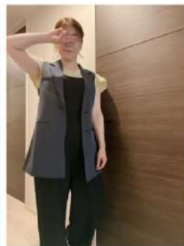
160cm 40サイズ ブラック

← 選定中のお客様と近い身長かつ違うサイズのお洋服の投稿画像はこちらに表示される