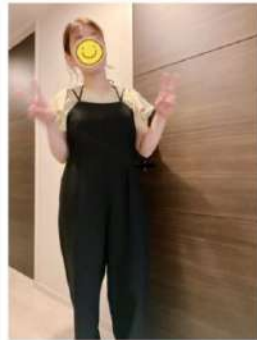
160cm 40サイズ ブラック