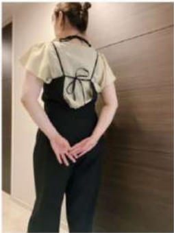
160cm 40サイズ ブラック