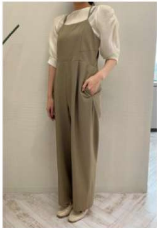
160cm 38サイズ ベージュ

みんなのコーデ画像は投稿された日時が新しい⇨古い順に並びます ※サイズ表記はお客様画面には表示されていません※