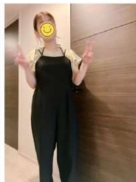
160cm 40サイズ ブラック