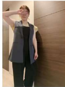
160cm 40サイズ ブラック