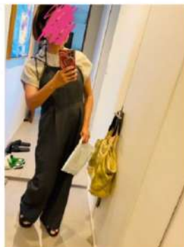
157cm 38サイズ グレー