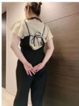
160cm 40サイズ ブラック