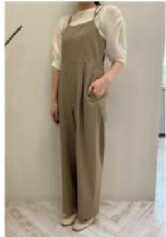
160cm 38サイズ ベージュ