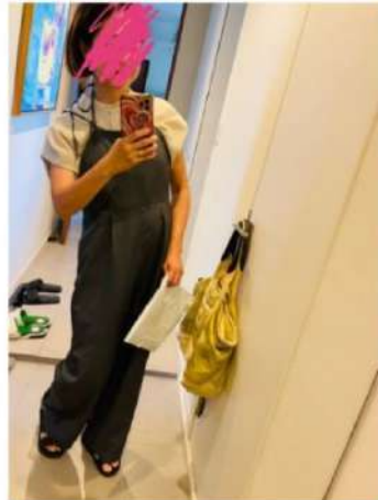
157cm 38サイズ グレー