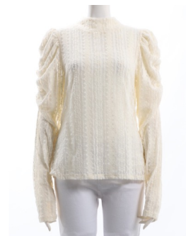
SKU ID : 127084 Brand : Jeune garçon Size : 40