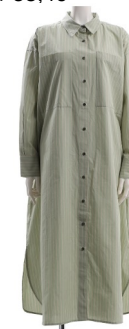
SKU ID : 119897 Brand : lil nina Size : 38