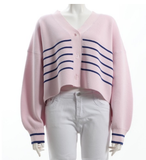
SKU ID : 137175 Brand : ADAM ET ROPÉ Size : FMS