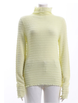
SKU ID : 135137 Brand : ELGNA Size : 38,40