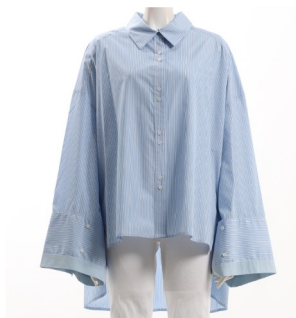
SKU ID : 136647 Brand : CUMIN Size : 38