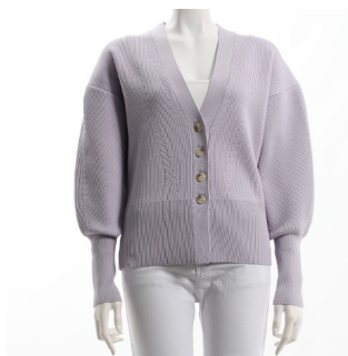
SKU ID : 134689 Brand : DONA MARIE Size : 34~44