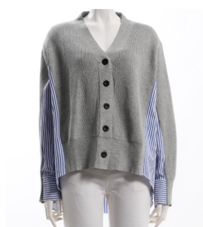
SKU ID : 136556 Brand : PALM RICHE Size : 38,40