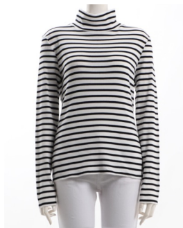
SKU ID : 125839 Brand : 23区 Size : 38,40