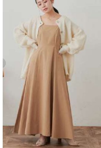
ブランド名 visit design ID:130422