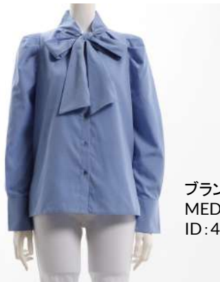
ブランド名 MEDDUM ID:45404