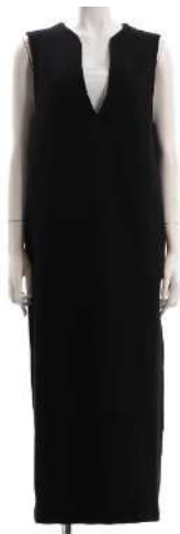
ブランド名 ALLUMETTE ID:129036