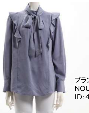
ブランド名 NOUQUE ID:45160