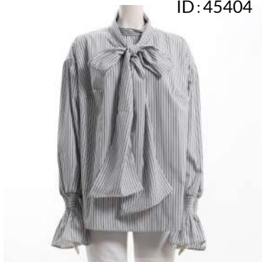
ブランド名 MEDDUM ID:45404