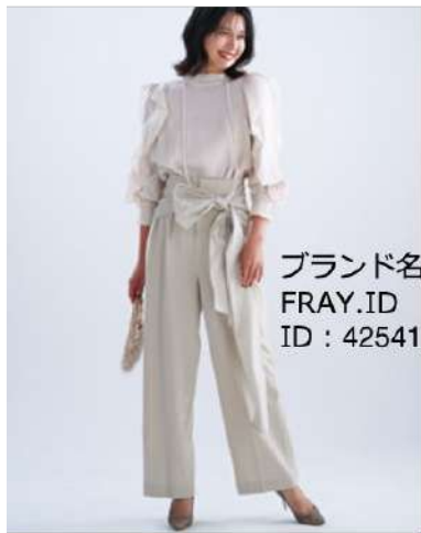
ブランド名(Pants) FRAY.ID ID : 42541