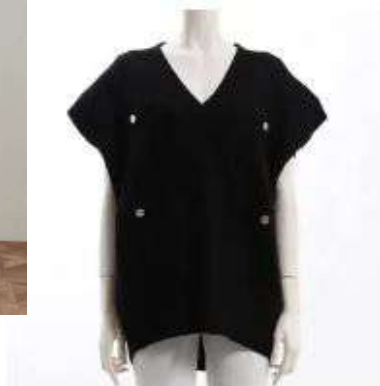
ブランド名 Hunch ID:127902