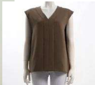
ブランド名 dolly sean ID:117757