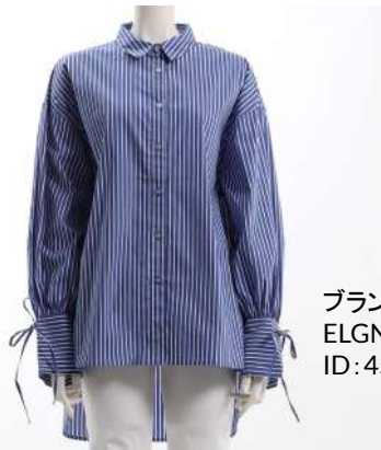
ブランド名 ELGNA ID:45488