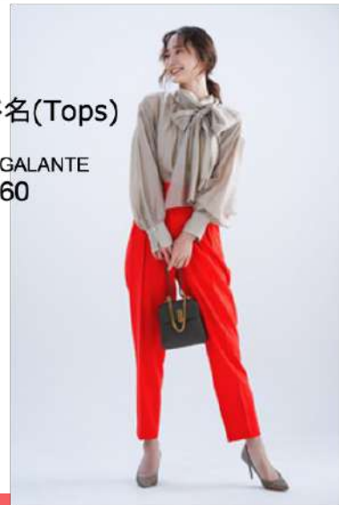
ブランド名(Tops) COLLAGE GALLARDAGALANTE ID : 40260