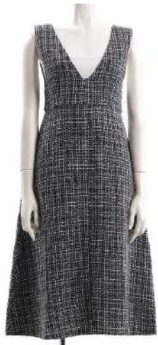
ブランド名 visit design ID:130450